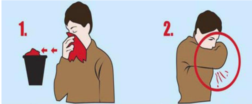
Figura 2.- Método de higiene respiratoria